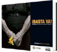
Tabla 1: Recursos y herramientas pedagógicas para la Cátedra de Paz

Título y autor: ¡Basta Ya! Colombia: memorias de guerra y dignidad Grupo de Memoria Histórica