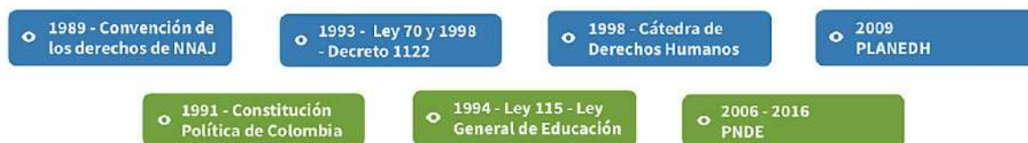
Gráfico 1. Referentes normativos de la Cátedra de Paz

Dicha apuesta se armonizó con el Plan Nacional Decenal de Educación del Ministerio de Educación Nacional (2016-2026), el cual reafirma la importancia de “construir una sociedad en paz sobre una base de equidad, inclusión, respeto a la