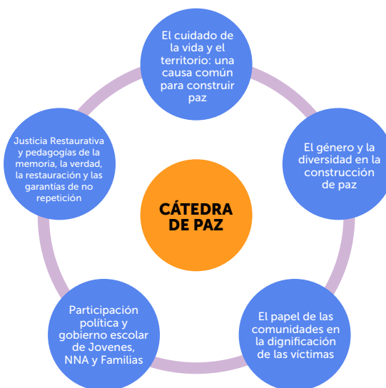
Gráfico 4: Líneas temáticas de la Cátedra de Paz

A continuación, se presentan las orientaciones para abordar cada una de estas líneas temáticas.